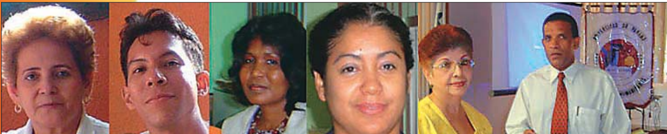
Algunos de los organizadores de la semana de la no violencia en la Universidad de Panamá.